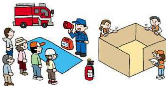
※防災訓練のイメージ