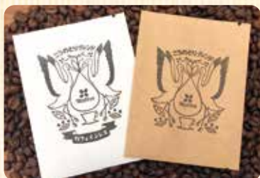
こうのとりのブレンド (78coffee)