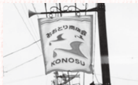
中山道のタペストリー