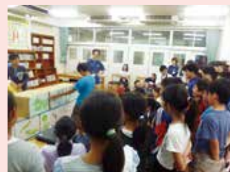
▲コウノトリを題材に生きもの同士のつながりを学習