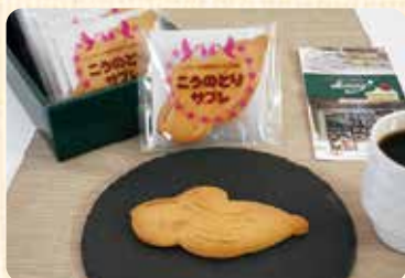
こうのとりのサブレ