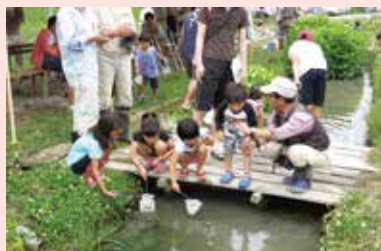
▲田んぼは、たくさんの生きものが生息する貴重な場所

市民・事業者・学校など、多くの皆さんと連携し、取組を支える担い手づくりを進めます。