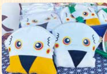
こうのとりのポシェット (左)・こうのとりのポーチ (右)