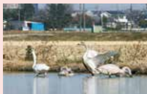
▲「冬期湛水管理」は、生物多様性保全に効果の高い営農活動