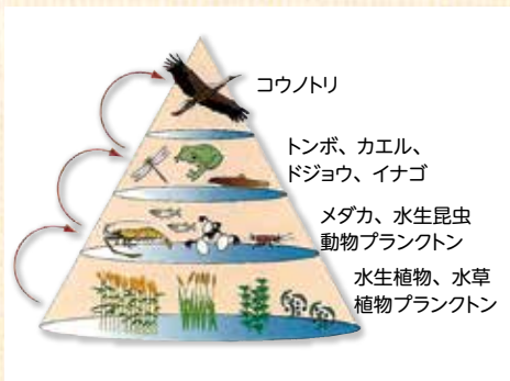
コウノトリを頂点とする 水辺の生態系ピラミッド