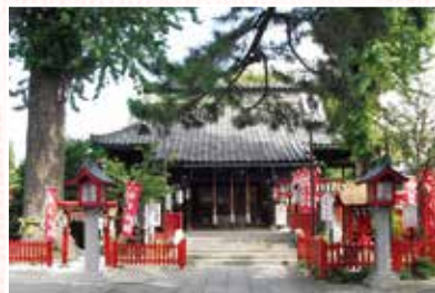
◀「こうのとり伝説」が伝わる鴻神社

市内にある鴻神社には、大きな木があり「樹の神」として崇め供養されていました。そこにコウノトリが巣をかけた卵を産んだところ大蛇に襲われ、木の上で渡り合い退治すると「樹の神」の災いがとけ、祟りを起こすことがなくなつたため、この地を「こうのす」と呼んだ「こうのとり伝説」が伝えられています。毎年10月に開催される「おとりまつり」では、伝説にちなんだパレードが行われ、多くの市民でにぎわいます。