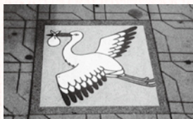
中山道のデザインタイル