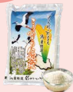
▲ほどよい粘りとほのかな甘みが特徴の「こうのとり伝説米」

農薬と化学肥料を5割以上減らし、埼玉県の特別栽培農産物の認証を取得している「こうのとり伝説米」のほか、コウノトリに関する商品（8ページ参照）が開発されています。