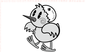
コウノトリのヒナがモチーフ 市メインキャラクター「ひなちゃん」