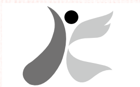
右側部分に「はばたくコウノトリ」を表している市章

市内では、さまざまなところにコウノトリにちなんだものがあります。皆さんもぜひ見つけてみてください。