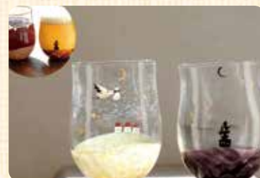
Horizon Stone グラス