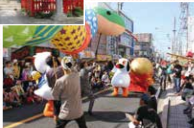
おとりまつりで披露される「こうのとり伝説パレード」▶