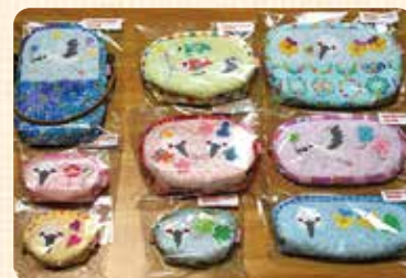
幸せを運ぶ こうのとりの手作り小物