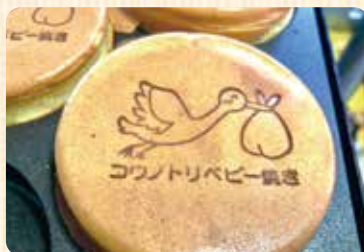
こうのとりのベビー焼き (大判焼き)