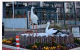
市役所本庁舎前のモニュメント