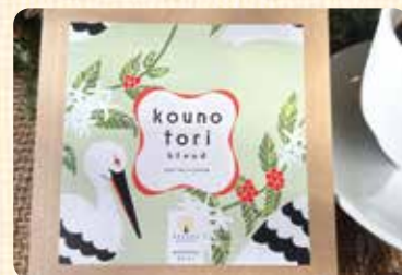
こうのとりのブレンド(きららカフェ)