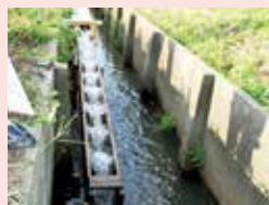
▲生きものに配慮した田んぼづくり

たくさんの生きものが生息できる環境づくりを進め、人にも生きものにもやさしい自然環境の保全・再生を進めます。