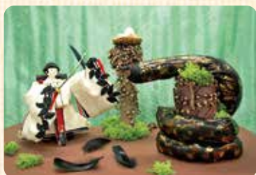
恒乃寿雛「こうのとりの伝説」