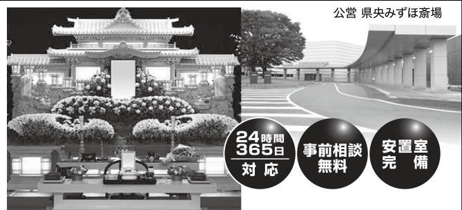
公営 県央みずほ斎場

JAさいたま / JA葬祭むさしの村 検索 ☑ むさしのホール鴻巣／鴻巣市中央 20-24