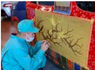
▲枝と花はすべてエアブラシで。枠に影を付けて浮き上がって見える効果も