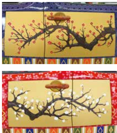
▲運転席側には紅梅、助手席側には白梅が描かれています