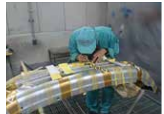
▲バンパーなどの模様は、貼り付けから塗装まで手作業で