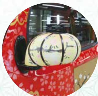
▲ぼんぼり雪洞をイメージしたサイドミラー

関東工業自動車大学校車体整備科の学生4人が、授業の一環として「ひな人形カー (Hina doll car with KANTO)」を制作しました。