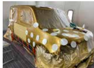
▲模様の位置は、バランスを考えて緻密に配置