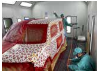
▲塗装は、スプレーガンで何重にも