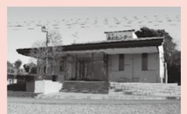
鴻巣典礼センター

このす商工葬祭はどなたでもご利用できます 24時間 365日対応 事前相談承ります