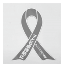
▲オレンジリボン 「児童虐待のない社会実現」を目指す運動のシンボルマーク

乳幼児は絶対に激しく揺さぶらないでください。脳内部の出血により障がいを引き起こしたり、網膜が傷つき視力障がいが残ったりするほか、命を落とすことさえあります。