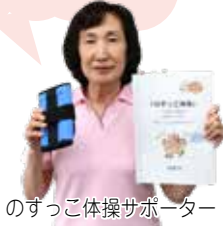
のすっこ体操サポーター

最初の数回はサポーターが指導します。体操で使う重りとバンドは市役所で無料で貸し出してくれます!