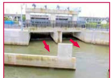
▲川面水門の元荒川からの取込み状況