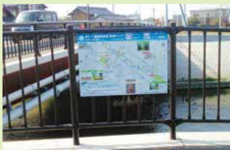
▲コース案内表示を市内18か所以上に設置しています