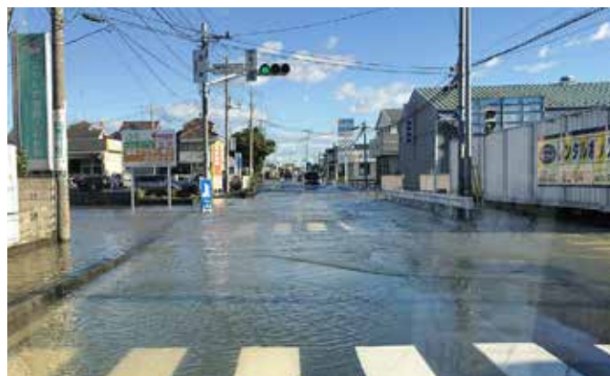
冠水した市内の道路

市内において道路冠水や床下浸水などの被害が発生しましたが、幸いにも人命に関わる被害はありませんでした。荒川や元荒川の水位上昇により、市内一部地域に対し避難勧告、避難指示を発令するなど、これまでにない大型台風の襲来により多くの課題が浮かび上がりました。 さまざまな災害の中で、風水害は気象情報をもとに予測することができます。 本号では、新型コロナウイルス感染症予防を踏まえた災害対策、日頃の備え、市の取組を紹介いたします。