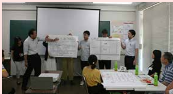
昨年の共同研究ワークショップの様子