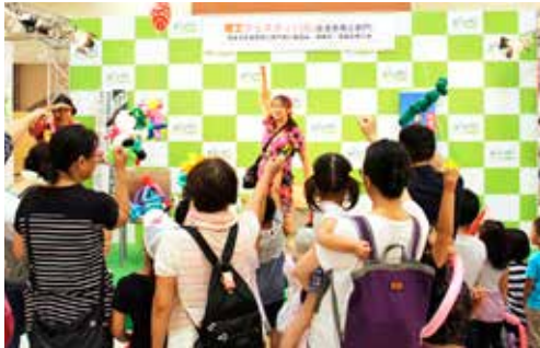
▲ 大盛況のステージイベント

9月3・4日に、エルミこうのす周辺を会場として「鴻巣市商工フェスティバルwithこうのす」が開催され「きて・みて・やって」をテーマに市内の商工業製品の展示や販売、ステージイベントなどが行われました。