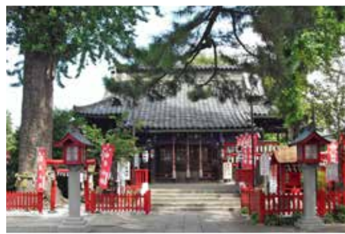
鴻神社の社殿と両脇にそびえる大銀杏

おおとり祭りは、元は鴻神社の秋の例祭です。華やかに飾り付けられた大きな山車が曳かれ、大変賑わったといわれています。現在も「こうのとりの通り」など、市民がコウノトリに親近感を持っているように感じます。鴻巣は、古くから宿場町として栄え、歴史と伝統を伝えるまちです。遺跡や文化財、ひな人形や赤物づくりの技術など、後世に残していきたいものが数多くあります。これらの貴重な情報資産を埋もれさせることなく発信し、後世に伝えていくことはもちろん、価値あるものとして活用していくことができればと思います。まずは「知る」ことで「わがまち鴻巣」への愛着につながっていくと思います。特に、新たに市民となった人たちに知ってもらいたいですね。市でも、市民が誇りや愛着を持てるような取組を進めて欲しいです。