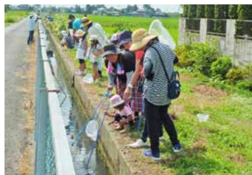
水路に生きものがたくさんいたよ