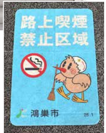
中山道～鴻巣駅に設置されている路面標示