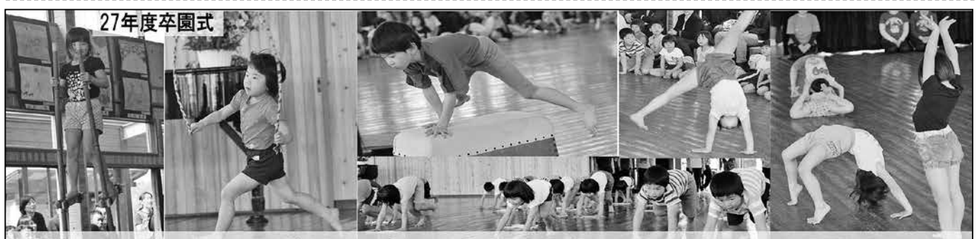
27年度卒園式 乳幼児期、本当に大切なことは何か、求め続けて40年 鴻巣ひかり幼稚園（ひかりっこ保育園併設） 公開保育実施中（毎週金曜 要予約）詳細は公式HPで 電話 048-541-3506 HPアドレス http://hikari.web2.jp/htdocs