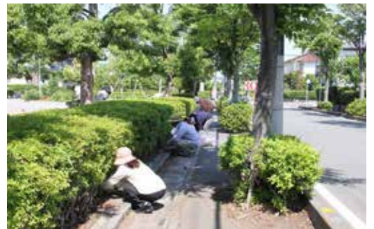
春のクリーン鴻巣市民運動