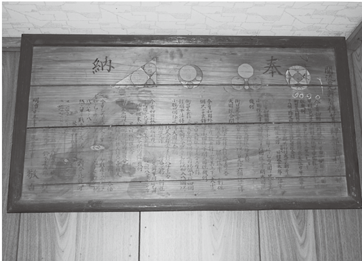
新井稻荷神社の算額〈市指定 絵馬〉 (新井 稻荷神社蔵)

〒365-8601 埼玉県鴻巣市中央1番1号 TEL 048(541)9001 FAX 048(541)1327 ホームページ https://www.city.kounosu.saitama.jp