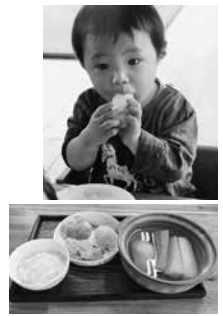
「手」の指は突き出した脳髓「手」をつかみ食べ「根」を根菜を

問 八幡田・下谷・登戸の市営住宅の建設で、低所得者の住宅確保で「住まいは人権」の実現を。