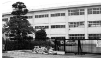
解体が早い日も、強度の低下も、吹上中学校普通教室棟

Q 耐震強度の低い危険な吹上中学校旧校舎の解体及び改築は、いつ頃から着手するのかが伺えます。 A 旧校舎の解体設計は、今年度中の予算計上を考えています。