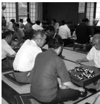
碁を楽しむ高齢者

Q 白雲荘は、元気な高齢者が利用する施設として大変喜ばれています。介護予防拠点としての整備計画を伺います。 A 十八年度から十九年度の整備計画書を県に提出し、六月予定で内示を待って、改修