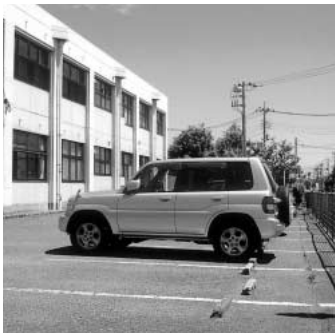
埼玉県が買収予定の駐車場敷地

Q 長崎屋脇道路（旧中山道と国道十七号間）の拡張計画が明らかとなり、この道路に面した箕田公民館の駐車場敷地に県に買収されることとなりました。市は、駐車場敷地を売却後、その代替地を確保