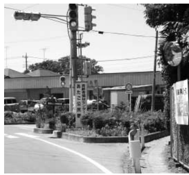
歩行者スペースの安全確保を

Q 主要地方道さいたま鴻巣線とあたご公民館通りとの信号機設置場所のうち、通学路でもある歩行者用スペースが狭くて危険なため、形状変更による拡幅ができないか。