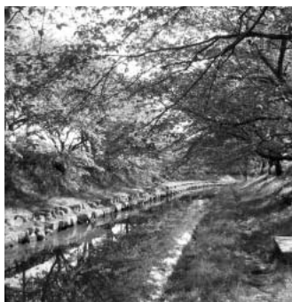
「元荒川の緑の桜並木」

Q 財政基準となる四指標の整備状況と情報開示は可能か。 A 市は健全化判断比率となる財政四指標を公表します。「実質収支比率」と「実質公債費比率」は公表しています。新たに「連結実質赤字比