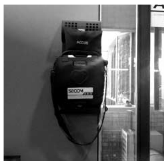
市役所1F総合案内所に設置されているAED

Q 市民の命を守るために工夫や仕組みによって突然死を防ぐという取り組みがあります。その中でもAED（自動体外式除細動器）によって心臓突然死から一人でも多くの命を救うことについて、AED