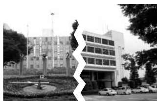
深まる県と鴻巣市のミゾ

Q 原口市長が鴻巣市の命運を賭けて戦った、四月八日投票の県議選後、県と市の関係で支障をきたすことはないか伺います。 A 特に何か支障が出ていないとは耳にしておりません。これ以上は、私の政治信条、政治活動に關するものなので、答えは控えめです。 Q 上田知事の予定に合わせて設定されていた五月二六日の花久の里の開館式への欠席は知事の出された鴻巣市への答えであると考えますが、明確な理由を把握していますか。 A 理由を確認するようなことはしていません。 Q 県議選を通じて、市民の為にどんな見返りを期待しますか。 A とりたてて市民の具体的な内容について見返りは期待しておりません。