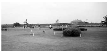
最近のパークゴルフ場の風景

Q パークゴルフ場利用者増加に伴う対応と防災対策は。 A 予約状況をゴルフ場で確認できるように、掲示する方法で対応