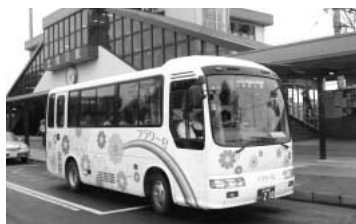
フラワー号に市民の声反映