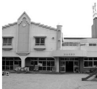
保育所日曜・祝日の需要もあるが...

Q 日曜・祝日も保育サービスを実施する考えは。 A 次世代育成支援行動計画策定時に実施した調査において、日曜日や祝日に保育サービスを利用したいか調査したところ、「利用希望がない」