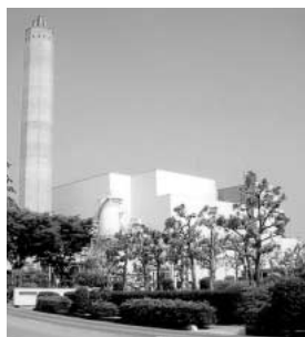
埼玉中部環境保全組合環境センター

Q 管内の廃プラスチック類の資源化処理、再生利用等の施策整備の新たな拠点となるプラザ建設地は、鴻巣市にと、中部環境管理者から懇請が市長にきているが、受けるか否か。 A プラザ施設の建設地につ