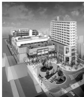
中心市街地活性化

Q 本年秋にオープンする駅東口再開発の商業テナントと地元周辺商店街との共存・協働による街づくりの推進策は。 A 『中心市街地活性化基本計画』の市街地整備に関する事業として、少子高齢化社会を背景とした商業・住宅・公