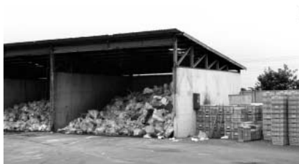
川里地域不燃物ストック場