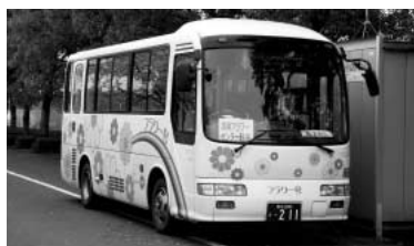
「市民の足・・・フラワー号」

Q 常光・笠原・安養寺・八幡田地域への公平なバス路線計画はどのように考えているのか。 A この度の駅西口地域へのバス新路線の導入に際しましては、優先度の高い地域から導入を図る。空白地交通 域については各地域の状況や市の財政状況を見ながら導入を検討していく。 福祉施設送迎バス及びフラワー号の見直しを行っていくなかでその他の交通空白地域についてのバス導入も検討していく、この三点を市の基本的な考え方とします。常光・笠原・安養寺・八幡田地域は、バス交通の空白地域として残されることとなります。が、運行検討の時期は平成十九年、二十年の二カ年を考慮しております。