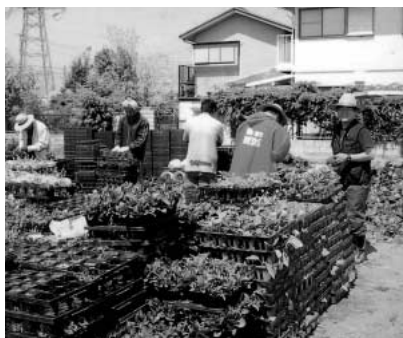
花の出荷を手伝う障がい者

Q 就労機会を望んでいる障がい者を公共施設の清掃・草取りに雇用する考えはないか。 A 「就労の訓練として雇用