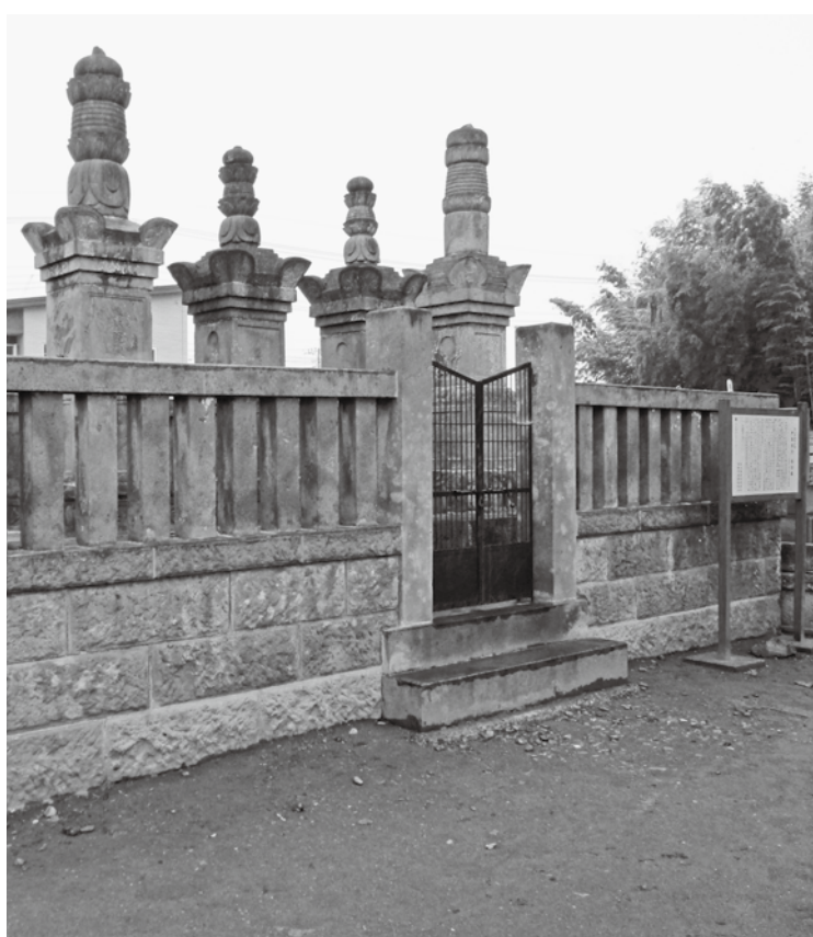
いなただつぐ ただはる 伊奈忠次・忠治の墓（県指定 史跡） 勝願寺（本町 8-2-31）

ホームページ http://www.city.kounosu.saitama.jp