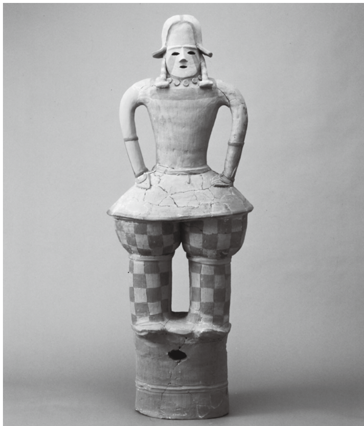
埼玉県生塚埴輪窯跡出土品（国指定重要文化財 考古資料） クリアこうのす（中央 29-1）にて展示中

東京2020オリンピックの公式エンブレムが組市松紋に決まり、市松模様が脚光を浴びています。市松模様は元禄時代の歌舞伎役者「初代佐野川市松」が着ていた衣装が名前の由来です。本市所有の「生塚埴輪出土の貴人埴輪」（6世紀）にも市松模様があります。袴の部分は格子状の線刻を施し、赤彩で色分けしてあり、見事です。クリアこうのす内、歴史民俗資料コーナーへ足を運んで、是非、古墳時代の市松模様をご覧ください。