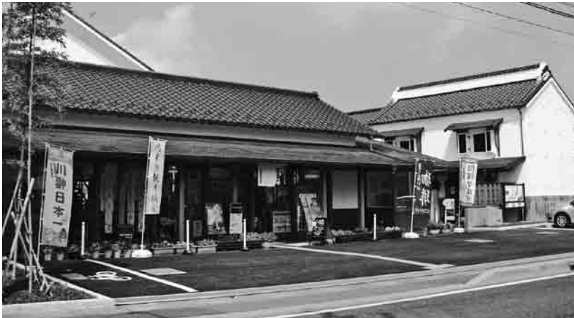
中心市街地の活性化を担う「産業観光館」

答 総額3億2670万円余りをかけてオープンしましたが、国の補助金や合併特例債を活用したため単独負担は1割です。なお、2