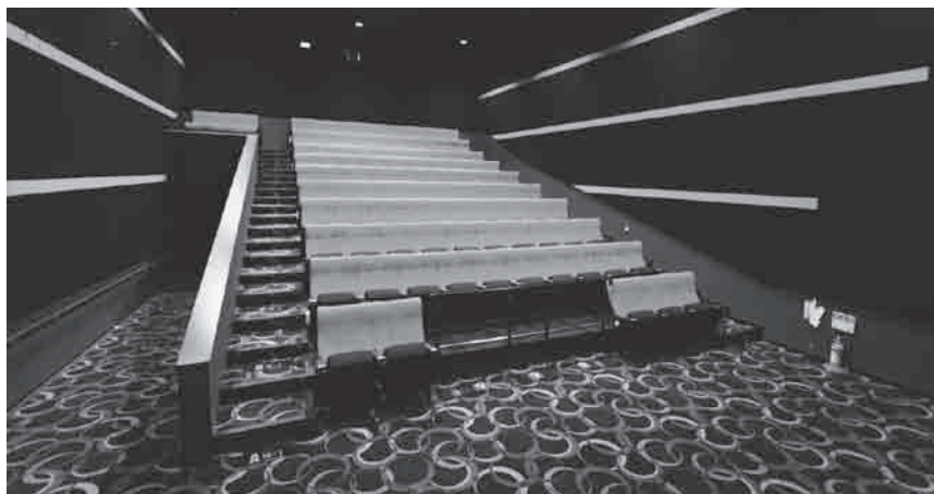
今後活用されるホール

及び市民ホールとして整備する費用であり、その修繕費や備品購入費です。今後は、運営面の維持管理費が発生すると想定されます。