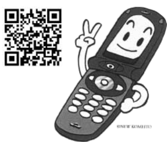
市の携帯サイトは 便利な機能がいっぱい!!

問 市の携帯サイトはコミュニケーションティーバスフラワー号の時刻表など便利な機能が多い。子育て情報などを含めた、さらなる内容の充実とQRコードの周知の工夫はできないか。 答 今後は子育てサイトはもちろん他のサイトについても充実させるよう協議検討していきます。広報やバス車内にQRコードを掲載し、携帯サイトの紹介を行っていきます。