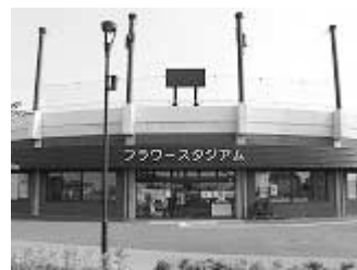
インターネットで予約(上谷総合公園)

問 インターネット利用による、スポーツ施設の予約システムがスタートして一年半が経過しました。市内利用団体からは、利用しづらいとの声も聞こえます。現在の利用登録状況や、市民優先のシステム導入について伺います。