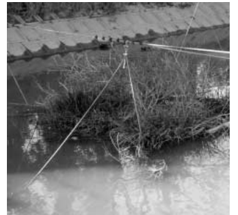
よみがえれ!豊かな川づくり 前谷落の植生浮島

問 元荒川は、名前のとおり荒川と利根川が合流していた頃は、荒川の本流でした。元荒川の源流付近には、世界でも熊谷市にしか生息していない希少な魚「ムサシトミオ」が生息しています。