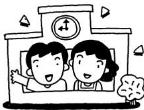
勉強に集中できる環境を

エアコン設置する事は、環境負荷や財源上多額の費用がかかるため全教室の予定はないが、まずは図書室や音楽室等一部の特別教室の設置を進め、国や近隣団体の動向を注視していきたいと考えています。