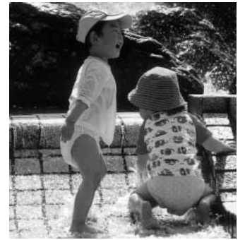
水遊びをする子ども

問 市民プール跡地利用は子ども達が水に親しめるような「せせらぎ」を備えた施設を整備し、子ども達の歓声があふれた施設にしたいとのこと。行田市市民プールの中にある水遊びができるような施設