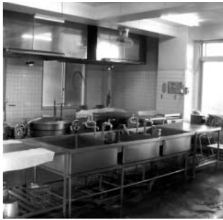
老朽化した 松原小学校の調理施設内

問 吹上、川里地区小学校の給食は自校調理方式とすることが決まりましたが、その事業計画について伺います。 答 川里地区の3小学校は平成23年度実施計画、24年度工事、25年度使用開始を目的に