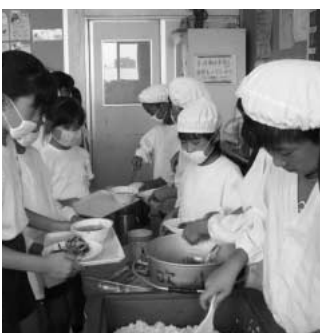
小学校給食の準備風景

答 川里地域の3校から給食調理室を建築します。平成23年度に実施設計、24年度新築工事、25年度から供用開始し、吹上地域は25年度工事、26年度から供用開始と考えています。