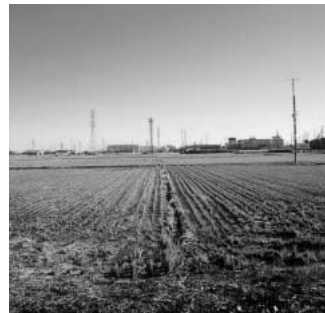
開発が検討されている農用地(箕田地区)

問 市長は本年6月、北鴻巣駅に近い17号国道沿線の箕田地区の農業振興農用地約11haの土地利用を見直し、総合病院の誘致等施設設置のための開発整備構想を発表しました。開発事業者はいつ頃までに