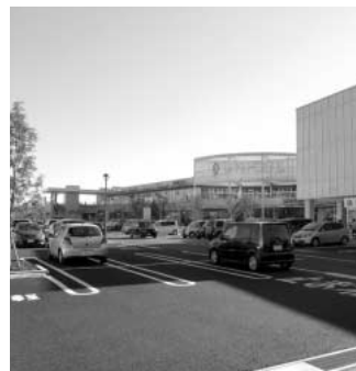
開発が進む北新宿区画整理事業

北新宿第二土地区画整理事業の10年目途の早期完了計画の内容について伺います。 答 事業見直し業務が本年9月で完了したので権利者説明会を実施し、権利者7割、換地面積割合で9割の賛同がありました。事業資金計画では35億円削減の約90億円となり、この見直し案で国・県への諸手続きを行い、平成24年度を新たなスタートとし10年後の平成33年度末を目標に事業完了を目指します。 問 小学校の統廃合の検討は行うのか伺います。 答 小学校の統廃合は複数の学校を一つにするだけでなく、小中学校の義務教育9年間の連続性や小中一貫教育の視点からも検討が必要で、今後研究を進めていきます。