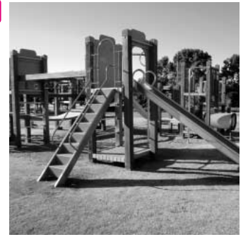
川里中央公園の遊具

問 小学生が放課後に学校の余剰教室などを使い宿題教室・科学教室・スポーツ教室などを学ぶ「放課後子ども教室」開設に向けた準備と方向性は。 答 平成23年度実施に向けて、教育部内の検討会を設け調査、