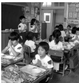
吹上小のおいしい給食

北新宿第二土地区画整理事業の10年目途の早期完了計画の内容について伺います。 答 事業見直し業務が本年9月で完了したので権利者説明会を実施し、権利者7割、換地面積割合で9割の賛同がありました。事業資金計画では35億円削減の約90億円となり、この見直し案で国・県への諸手続きを行い、平成24年度を新たなスタートとし10年後の平成33年度末を目標に事業完了を目指します。 問 小学校の統廃合の検討は行うのか伺います。 答 小学校の統廃合は複数の学校を一つにするだけでなく、小中学校の義務教育9年間の連続性や小中一貫教育の視点からも検討が必要で、今後研究を進めていきます。