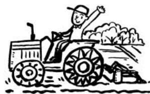
日本農業と地域経済を守れ!

問 農業をはじめ、日本経済に大きな影響を与えるTPP(環太平洋戦略的経済連携協定)には参加しないよう、国にしつかり意見を上げること求めます。 答 徹底した国民的議論が必要である