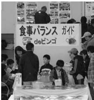
健康まつりをもっと盛り上げよう!

問 本年度策定中の鴻巣市食育推進計画が目指すもの。給食事業とのかわりには。 答 保育所・小中学校給食の栄養士を含む計画策定庁内連絡会で原案をつくり、地域保健対策推進会議で議論していきます。家庭・地域・仲間、みんなで食育を学び、育ち合い、健やかで心豊かな生活が送れる市(まち)を理念に掲げ5つの重点目標を設定し事業展開していきます。