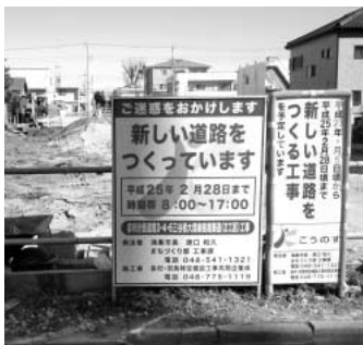
総合評価方式の導入を進めている市の入札制度改革

問 学校と地域ボランティアの一体感ある地域コミュニティづくりをどう推進するか。 答 県とともに埼玉子ども70万人体験活動や学校応援団、学校ファーム等の学校支援活動をを通して、地域社会が子ども 問 学校の学びを支え、学校は地域に貢献する共助の関係で、地域と連携する一体感あるコミュニティづくりを努めます。 答 学力調査は国又県方式が比較的有効であり活用します。 問 建設工事の品質確保や市内業者の受注機会の拡大は。 答 市は電子入札制度により品質確保のため入札金額を最低制限価格方式で決定します。来年度は災害等の地域貢献を行う企業努力を評価する総合評価方式の導入を進めます。