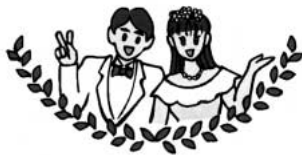
早く結婚したいなー

答 鴻巣市におきましては社会福祉協議会内において毎月第一水曜日と第三日曜日の午後1時から4時までの時間に結婚相談に応じ適切な助言・援助・紹介などを行い結婚の成立をお手伝いしております。