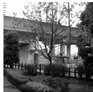
ずさんな見回りによって枯死した 石田堤史跡公園の樹木

問 尖閣漁船衝突事件に端を発し、北方領土・北朝鮮問題と我が国の外交が問われている現在、足下に目を向け本市の外交について伺ってまいります。国の事務も県を通して行なっているが、最大の影響