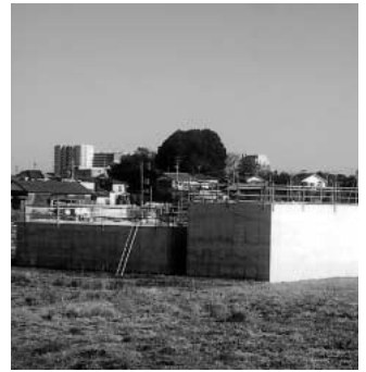
スーパー堤防建設の進捗状況

問 平成14年から進められている大間地区のスーパー堤防事業は、公園事業・ポンプ事業がありますが、進捗状況は。 答 国交省による委託工事として、堤防本体部分の樋管工事を23年6月末の完成を目指