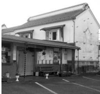
保存される明治時代の蔵

問 鴻巣のひな人形の伝統と文化の保存・継承する(仮称)歴史民俗資料館について。 答 ひな人形の伝統・文化の保存・継承とともに、花をはじめ地元特産品や各種イベントの情報、また川幅グルメ等の飲食店情報など、観光情報として発信する施設として考えています。また管理事務所・珈琲スタンド、正面の店舗部分は観光案内所や特産品情報や販売所として活用します。奥の店舗は、人形資料や鴻巣の歴史を代表する考古