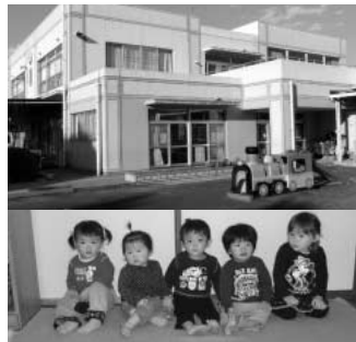
公立保育所(上) 家庭保育室のこどもたち(下)

問 平成23年度から、公立保育所の延長保育拡充策として終了時間を午後7時までと公表したが、開始時間も早い時期に7時とすべきと思うが。 答 終了時間の統一は、現状の職員体制で可能ですが、開