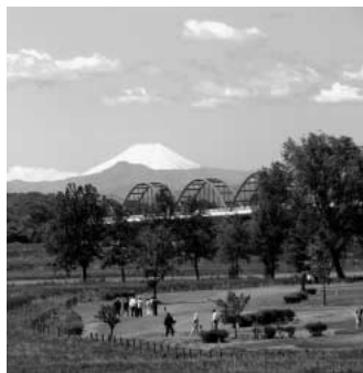
富士を背にパークゴルフ

問 住民に分かりやすく他市との比較が容易な財務書類の開示について伺います。 答 平成20年度決算で普通会計ベースと連結ベースでの財務四表を公表しています。今後は県や総務省による公表シ