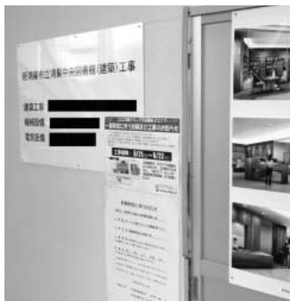
中央図書館建築工事？

問 公共工事における電子入札も形骸化してしまい、今では官制談合の温床とまで言われています。本市でも電子入札切後から開札までの間に、市担当者はそのシステムに業者が送った入札内訳を覗く事