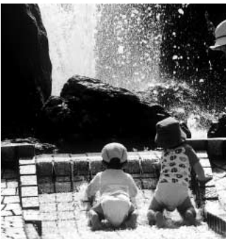
鴻巣市にもほしい!

問 子育て日本一を公約に掲げている原口市長です。子ども達の要望に応えられるよう、市民プールに替わる水遊びのできる施設の事業を計画すべきと思うが。 答 広く市民の意見や要望を