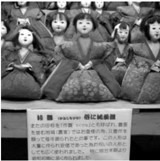
明治末期より昭和初期に作られた鴻巣びな

問 平成21年5月に廃業の約束が、引き続き営業するとして4000万円減額し、1億1000万円支払った。これは人形店の債務整理と思われるが、契約の白紙の考えは。 答 資料館の目的達成に支障