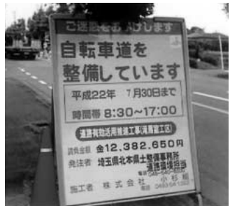
徐々に整備されている 自転車・歩行者専用道路 (県道東松山鴻巣線・御成橋周辺)

問 本市の水道施設は、老朽化も目立ち更新や補修を行うが、財政負担を考えライフサイクルコストを計画的に縮減する施設管理が必要でないか。 答 水道施設は水道事業基本計画に基づき平成32年度を目