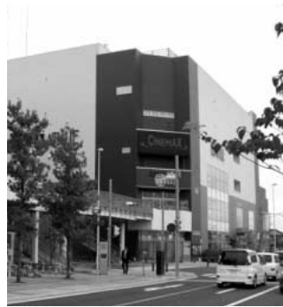
アネックスビル (A2街区ビル)

問 鴻巣駅東口A1街区、A2街区の整備は完了していません。しかし、保留床処分は資金計画の約62パーセントで止まっています。再開発組合の負債額について伺います。 答 再開発組合の平成21年度