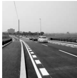
開通したふるさと橋

問 本年5月6日に工業団地通線が開通したが、その意義を市はどのように捉えていますか。