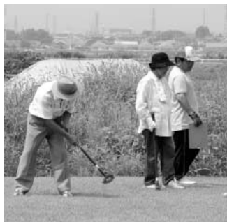
ナイスショット! (かわさとグラウンドゴルフ場)

問 ゴルフ場に行かなくても近くの広場で気軽に来るのがグラウンドゴルフ。愛好家の年齢層も幅広く、健康増進にも寄与しています。造成工事の進捗状況や完成後の利用について伺います。