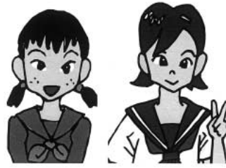
子宮頸がん予防ワクチン 公費助成は女子中学生が対象!!

問 子宮頸がん予防ワクチン接種公費助成が各地で始まり、急速に関心が高まっています。本市においてもより早い時期の実施を望みますが、市の考えは。 答 子宮頸がん予防ワクチン