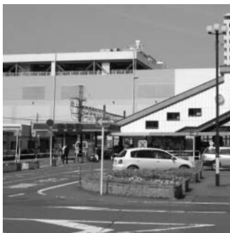
早期改修が望まれる西口

問 西口ロータリー内にある工事用仮フェンスを撤去し、しっかりと歩車道分離されたレイアウトに変更すべきと考えるがどうか。