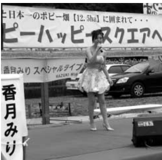
ポピーハッピースクエアの ステージイベント

問 今後に向けた新たな取り組みとして、体制や日程、テーマ、ポピーの活用策、周知方法について伺いたい。 答 長時間、本市の各会場に留まっていただけを「滞在型イベント」として「仮称このす花まつり」として、