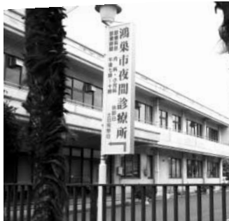
初期救急の対応ができる 夜間診療所

問 住民の命を守るために、安心できる地域医療体制を充実させる事は待ったなしです。とりわけ小児救急医療体制の現状と課題について見解を。 答 小児救急医療体制は鴻巣、上尾、桶川、北本、伊奈の4