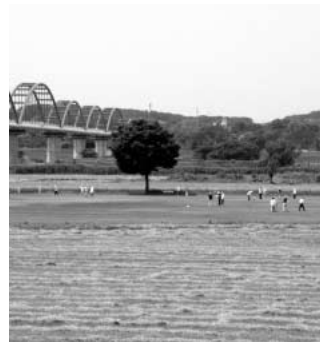
荒川総合運動公園

問 荒川総合運動公園緑地は合併主要事業であるが、整備計画と管理に問題はないのか。 答 整備は計画通り進めていきたいと考え、管理は団体へ委作地で貸しています。 問 安全で安心なまちづくり