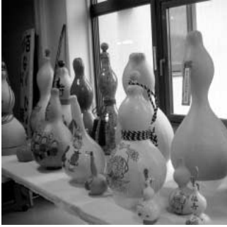
産業祭に出展された ひょうたん作品

問 産業祭での農産物物品評会の講評は。 答 例年800点以上の農産物が出品されます。穀類、野菜、花き、果樹、芋類、その他、苺、茄子、等の立毛共進会ごと部門別に特別賞21点、