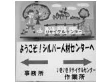
高齢者から期待されるシルバー人材センター

的となり犯罪や事件の温床となりますので、犯罪の要素を回避するため樹木の剪定をします。