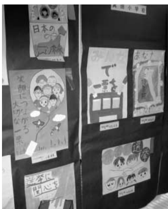
市内児童による選挙啓発ポスター

経費についても同日に4つの投票を行うには、新たに投票箱や記載台の購入、投票スペース確保のためのプレハブ設置などに2200万円程度かかることを踏まえ、選挙期日を決定しました。