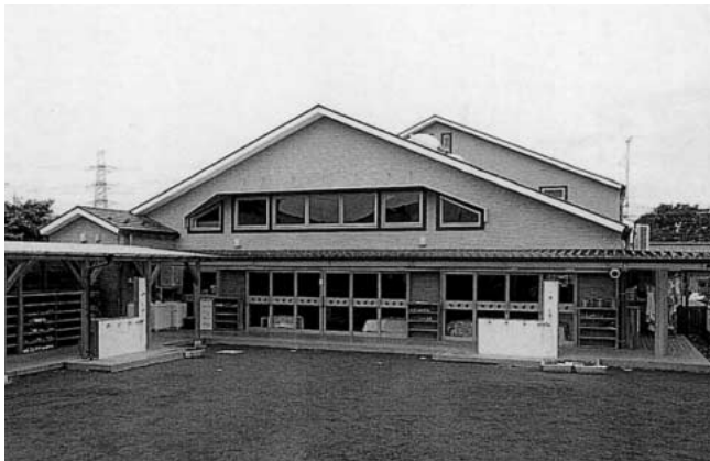
どんぐり保育園新園舎