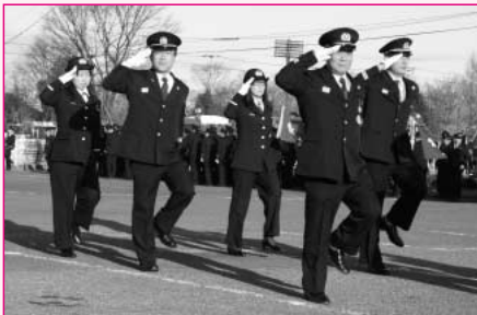
寒風について1月10日、市役所駐車場において出初式が行われました。現在、鴻巣市では414人の消防団員が活躍しています。女性隊員もがんばっています。