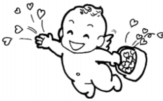
こどもの未来に期待

問 鴻巣市の福祉サービスの水準は、近隣自治体と比べてどのような状況なのか。75歳以上の高齢者に対する保養施設の助成金を上げてはどうか。こども医療費（15歳までの入通院無料）の現物給付化