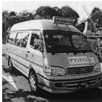
他市で活躍しているデマンドバス

問 鴻巣駅・本町・人形町經由の路線バスが大幅な減便となり、地域住民の大きな怒りとなっているが、対策は。 答 人形町から鴻巣駅までの路線を含めた市民からの様々な要望や課題を解決するため、