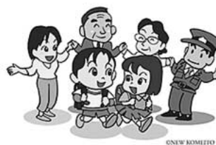
福祉・教育の連携で 教育支援センター設置

問 発達障がいのあるお子さんへの対応や保護者の相談体制には教育と福祉の連携、継続的支援が必要であるが、市としての具体策は。 答 仮称教育支援センターを設置し、幼児期・小・中学校