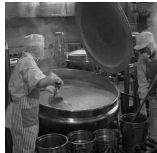
騎西鴻巣学校給食センターの調理風景

問 市内の学校給食の再編はどのようになっていますか。 答 平成22年4月から、中学校の給食はすべて、鴻巣学校給食センターより配食となります。給食費の統一が必要で、川里地域の小学校給食は、