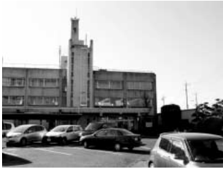
老朽化著しい吹上支所

問 市内には築後30年以上の公共施設が31あります。中長期的な視点から、これらの施設の改修構想あるいは計画が必要かと思いますが、執行部の見解を伺います。 答 改修改築は多額の事業費