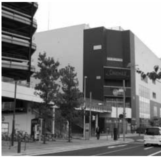
中央図書館が入る再開発ビル アネックス

問 再開発事業の終結を理由として、市が加入する再開発組合の情報も提供せず市費の投下は、市民の理解が得られない。なぜ急ぐのか。市長の選挙対策ではないのかとの声もある。市長の見解を問う。