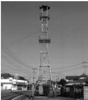
老朽化した火の見やぐら

問 昭和30年代に建てられた危険な状態にある火の見やぐらの取扱は。 答 10基ある火の見やぐらのうち、現在防災無線の子局として6基については、火の見やぐらを撤去。同じ場所