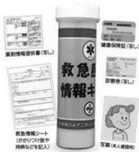
救急医療情報キット

問 救急医療情報キットの活用にて、救急現場での救急搬送の時間短縮化が計られ、受け入れ医療機関等での救助に大きな効果をもたらすと判断されるが、当市の考えは。 答 救急医療情報キットの活