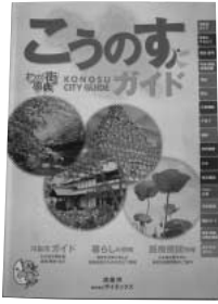
早くも廃品として出された このすガイド

問 「このすガイド」の発行は、本市と㈱サイネックスの協働事業であり、市はかかった費用を、業者は収支報告を市民に示すべき、また広告取引は。