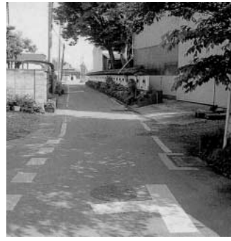
前新田から小宮へ

問 笠原地域に昭和30年代から50年代に道路拡幅の目的で買収済の箇所が、現在判っているのが3箇所ある。早期着工の時期を示してほしい。 答 笠原地域3箇所の道路改良工事は、いずれも全体事業