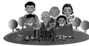
新たな共助としての “地域の支え合い”

問 地域福祉の推進課題として、高齢化が進行し様々な支援ニーズが増大する中、公的支援のみではサービス供給や財政負担の観点からも限界があります。高齢者の日常生活の家事や庭掃除等のお手伝い