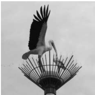
鴻巣駅前に設置されたこうのとりのもニュメント

問 市の花や木は市制施行後の記念時に制定されている。本市ではこのとりに関係する伝説やまつり、モニユメント等つながりが深い。最近ではこのとりを育む会の署名活動も始まっている。