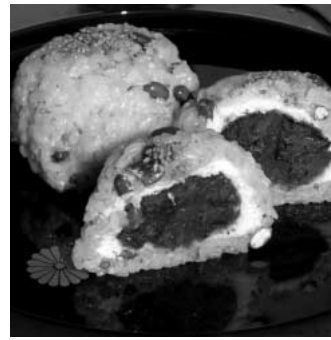
鴻巣名物“いがまんじゅう”

問 市内には、文化財を含む地域資源や食を含む特産物、さらには伝統芸能を含む無形資源などが数多くあります。それらをうまく活用しながら本市を効果的にPRする方法は。また、大使制度の導入に