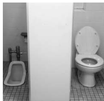
洋式トイレへの改修(田間宮小)

問 耕作放棄地解消の具体策について。 答 本市では耕作放棄化している農地面積は10haあり今後増加の懸念があります。農地管理は農業委員による農地パトロールの実施、意欲ある