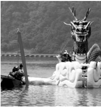
金山町湖水まつり

問 新市として引き継いだ、旧吹上町と金山町との友好都市関係を相互発展的な関係にするための課題は何か。 答 金山町は四季折々の大自然と、いで湯に恵まれた町ですが、過疎化が進んでいるこ