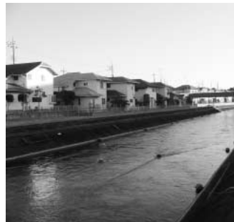
住宅地を流れる武蔵水路の安全対策は

問 水資源機構が武蔵水路改築を計画しているが、周辺地区の要望をどう捉え、安全対策をどのように図るか。 答 平成20年11月に水資源機構に対し、12項目の要望を出し回答を得ていますが、安全