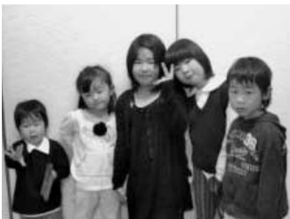
子どもたちのために!!

問 窓口申請書をなくして、保険証・受給資格証のみでの対応をすることはできないか。 答 受給者が医療機関に支払った医療費の支給を受けるためには、受給者本人からの請求に基づき、支給することが