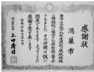
さらなる徴収率向上を目指して

問 市財政を支える重要ポストである徴収部門に優秀な人材を多く配置し、充実を図ることに ついて。 答 税の収入未済額の圧縮と徴収率向上を目的としたプロジェクトを設置し徴収を強化。