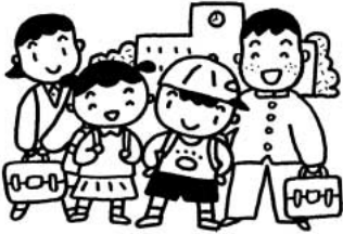
子どもは社会の宝

問 保険証の留め置きはしないこと。 子ども達は親を選ぶことはできません。親の経済状況で子ども達に不利にならないよう支援すること、国民健康保険税が滞納の場合でも、子ども