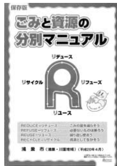
ご覧になりましたか？

問 平成20年4月からゴミ収集方法が統一されました。約1年が経過した現在の状況や今後の施策について伺います。 答 分別マニュアルや日程表の配布、さらに広報「かがやき」での周知によりゴミ減量