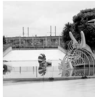
閉園された市民プール

問 市民プール跡地利用庁内検討会の「ちびっこプール」に替わる親水施設の検討の期間は、いつ頃までに結論を出すか。 答 「ちびっこプール」に替わる親水施設の検討の期間は、