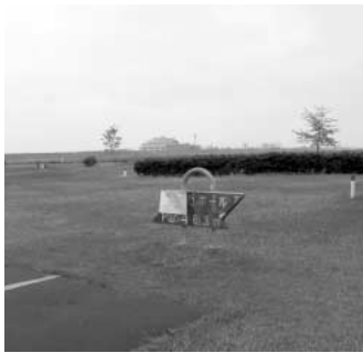
吹上荒川総合公園パークゴルフ場 インコース1番ホールティーグラウンド

問 吹上荒川総合公園パークゴルフ場は平日、市民に限って500円で2ラウンドのプレーが可能ですが、土日祝日は1ラウンドしか出来ません。土日祝日も平日並み扱いにすべきと考えますが、担当課の