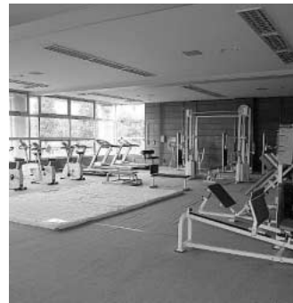
いつでも誰でも使える施設に

問 総合体育館のトレーニング室は、講習を受けたいと思えません。この講習会の日程が土日と夜間になっていきます。幼稚園や小学校のお子さんをもちのママ達が講習を受け易くするために、「日中の講習会を」という要望が多い。今年の4月から総合体育館は指定管理者の管理になるので指定管理者にその要望を伝えてほしいと思います。 答 指定管理者からだされている提案では、トレーニング室に常時トレーナーを配置します。また、講習会も利用者の状況や時間に合わせて週2回行う予定ですのでどなたにでも使い易い物になります。 問 利用料金の変更はありませんか。 答 料金の変更はありません。