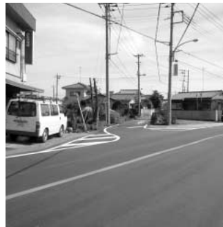
安全対策を講じた路面標示

問 松原3丁目3番5の44前市道を県道さいたま・鴻巣線から、進入のみの一方通行にすることについて、過去の一般質問以降の状況と見通しは。 答 当該道路が、県道のカーブ箇所、大変危険な箇所であることから、一方通行にする