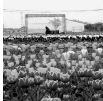
花のイベント会場を盛り上げるフラワーアレンジメント活用事業予定

問 雇用の破壊が広がる中、雇用の確保と中小企業者の経営を守る取り組みは急務です。生活に密着した公共事業を前倒しで、市内業者の仕事を増やすこと。 答 国の交付金1億8千万円