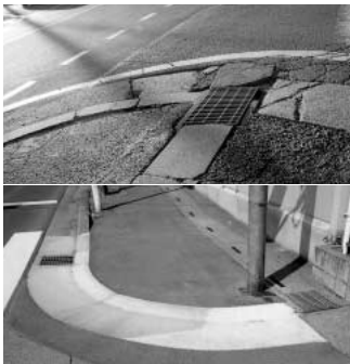
凸凹に壊れた歩道とバリアフリーブロックのコーナー

問 アメリカ発の経済不況が全世界に蔓延し、日本の实体经济は会社の倒産・派遣切り・減産と、百年に一度の深刻な危機です。定額給付金が支給されるが、市内の経済活性化策としての取り組みを伺う。