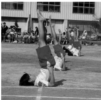
つま先まできれいに伸びてます

問 実技に関する調査結果は、国・県の平均記録と比較しても本市の児童生徒の体力はともに上位にあり、高い体力となつています。特に小学校の男女は、調査96項目中89項目が県平均を上回り、上回