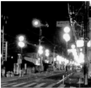
商店街の環境整備 防犯灯の役目をしている 商店街の街路灯

問 住民自治のあるべき姿や将来的な目的を決め、その方向に市民・行政・議会が共通認識と行動規則のもと、基本理念・基本的原則の自治体運営ルールを確立することが大切と思うが、見解を問う。