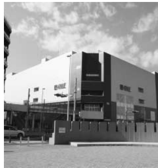
未完成を理由に税金を免れている組合所有のビル

問 一部の議員が執行部に対して歯の浮く様なお世辞を言う。また、質問しては答弁貰って礼を言う。それを見ている職員は、全議員が馬鹿に見えるてくるのかな鴻巣では。それが過熱した職員が、他の議