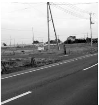
広田中央特定土地区画整理事業地

問 平成21年度予算は地域の均衡ある一体性の確立予算なのか。合併前の基幹事業である「広田中央特定土地区画整理事業」の進捗は。 答 用地の購入を終えている広域交流拠点整備事業では多