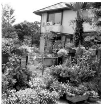
色彩やかなオープンガーデン

問 4月から新たにスタートする、花かおり課の目指す事業はどのようなものなのか。 答 多くの市民の方々が参加できる花のコミュニティづくり事業や、オープンガーデンなどの花を楽しむ事業の推