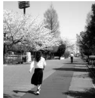
メタボ予防にウォーキングを

問 特定健康診査の結果は、平成20年度から40歳〜74歳を対象に「特定健康診査」を実施しています。現在までの受診者は8900人で受診率は39%です。メタボ該当者が積極的支援291人、動機