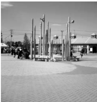
賑わう近隣の道の駅

問 地元物産の販路拡大策と「道の駅」づくりは。 答 このことは、経営の安定や地域の活性化につながるばかりでなく、消費者ニーズに有効と理解しており、スーパーでの販売促進・産業祭など