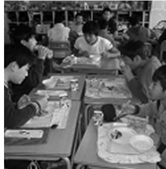
待たれる給食の再編

問 温かくて美味しい、そして安全・安心な給食の供給実現のためには、全体を賄える給食センターの建設が必要と思うが。 答 理想ですが現在の財政状況では大変難しい。平成21