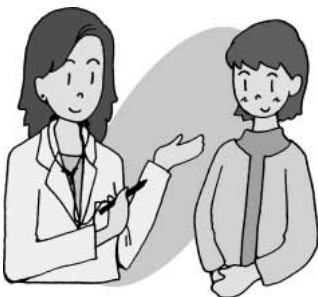
気軽に相談できる体制づくりを

問 更年期障害など女性特有の病気等の健康相談窓口を設置できないか。 答 今年度は更年期を穏やかに乗り越えて健康的な生活を送ることを目的とした「女性のための健康講座」を初めて