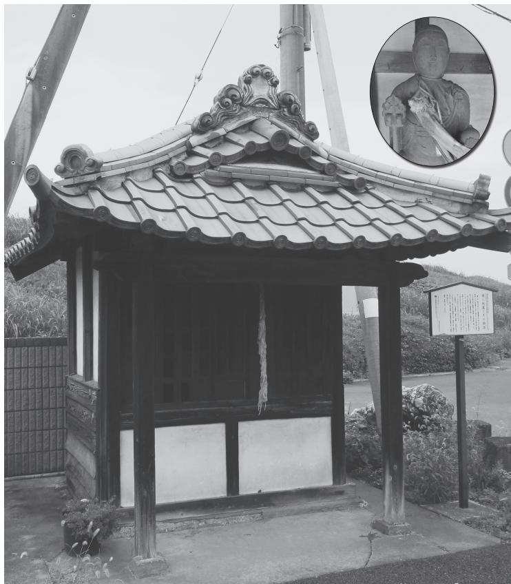
こんばちじぞう 権八地蔵とその物語〈市指定 民俗資料〉 (荊原地内)

〒365-8601 埼玉県鴻巣市中央1番1号 TEL 048(541)9001 FAX 048(541)1327 ホームページ http://www.city.kounosu.saitama.jp