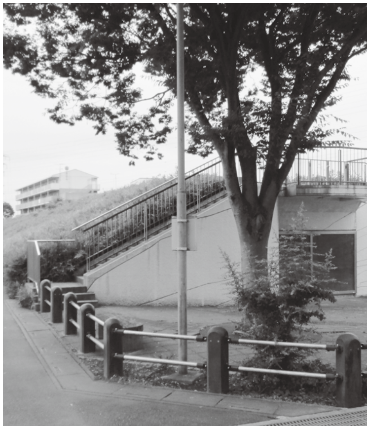
いしだつすみ 石田堤 〈市指定 史跡〉 (袋 326-1)

ホームページ http://www.city.kounosu.saitama.jp