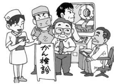
早期発見・早期治療でがんは怖くない!

問 がん検診受診率を上げるために、検診方法や周知方法を見直して可いかな。 答 18年度のがん検診受診率は乳がん9・2%胃がん4・4%肺がん4・4%大腸がん