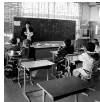
ブラジル人学校の授業風景

問 農業政策について、本市の食料自給率と自給率増への具体的な取り組みについて。 答 鴻巣市の食料自給率はカローリーベースで32%であり国より低い状況となっております。地産地消の観点から学校