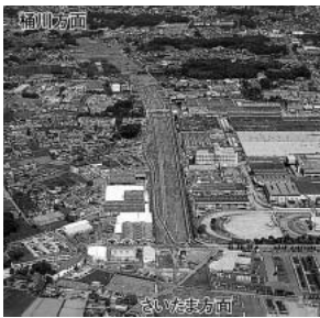
本市域への事業化が待たれる上尾道路

問 道路特定財源について市長の見解を問う。 答 国が事業を進めている上尾道路は、鴻巣市箕田までの区間の整備が急務とされており、この財源は道路特定財源と伺っています。本市の事業では、三谷橋大間線整備事業