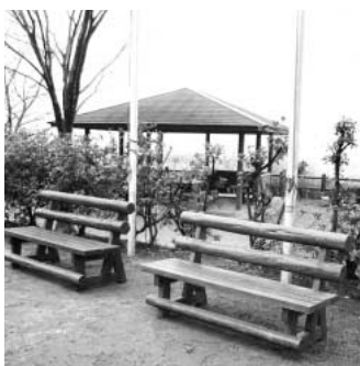
設置された木製ベンチ

問 健康で長生きを喜び合える社会をつくりたいものです。高齢者の健康増進のために、高齢者が多く集まる公園に健康遊具の設置を求めます。 答 グラウンドゴルフを楽しむ高齢者の方々が集まる公園