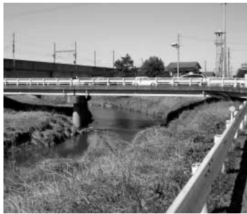
元荒川に架かる郷地橋

問 市内の国道、県道、市道に架かる橋の実態(数)は。 答 国道が5橋、県道が22橋、市道が61橋で合計88橋です。