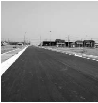
整備が進む区画道路

問 行政改革は、職員意識改革でもあり、市民イコールお客さまで、この評価は市民の満足度に表れる。市長のこれまでの行政の取り組みの成果と検証は。 答 事務事業評価の公表を通