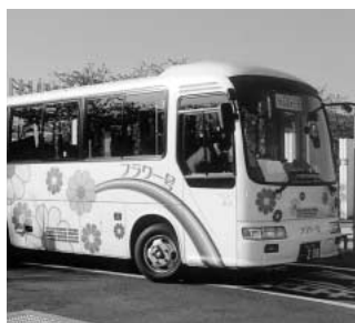
我がまちのフラワー号

問 空白地域の笠原、常光地区への運行計画予定は。 答 交通空白地域につきましては平成20年度早々には新たなコース案を地域公共交通会議に提案し、平成21年度早々には運行を開始したいと考え