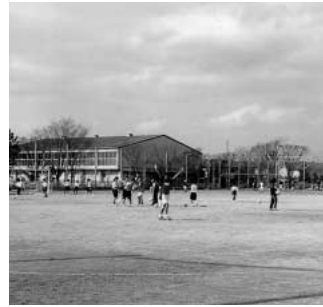
部活動に励む生徒たち（赤見台中）

問 文部科学省は、新教育基本法に基づき、平成20年度から向こう5年間の重点8項目の政策と重点施策75項目を柱とする教育振興基本計画の作成を進めています。埼玉県はすでに5回の会議を開き基本