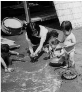
「どろんこ遊びは気持ちいい」

問 住宅棟3階、4階の空スペースやA2街区の映画館の出店とりやめなど、事業の展望の見えない中、C・E地区の住宅型の再開発の見直しは、 答 A・C・Eの3地区の整備が鴻巣駅東口の整備の完成とを考えています。