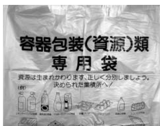
資源 資源 資源！

問 我が国は経済成長と共に、廃棄物も増大の一途を辿っています。埋め立て最終処分場も危機的状況にあることから限りある資源のリサイクルについて伺います。 答 ごみの減量化を図る上