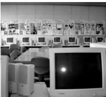
広田小のパソコン教室

問 平成20年度予定される事業はどのようなものですか。 答 県道鴻巣羽生線からフラワー通りまで、平板測量基準点測量、中心線測量、縦横断面測量を行います。