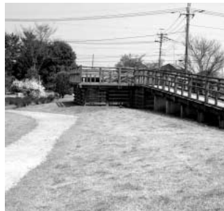
シルバーによってきれいに管理されている公園

問 「ハイヨー！シルバー」の掛け声も勇ましく、「高齢者の雇用の安定等に関する法律」に基づいて全国の自治体に産声をあげたのが、シルバー人材センターの基となる組織でありました。それから20年が