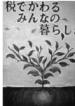
市民の目線で解りやすく、実感がわいてくる税金の還元を！

問 市民生活に関する市の運営コスト（税金）を解りやすく表示する方法は。 答 市の財政状況は広報ががやき・ホームページに、予算上の費目ごとに市民一人当りの費用に換算して公表してい