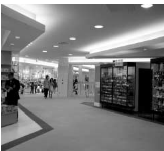
担保物件となっているエルミ鴻巣ショッピングモールの3階の一部

問 保留床取得法人(株)エルミ鴻巣へ9000万円融資した返済計画を示すこと。 答 5年間は据え置きし、6年目から毎年600万円ずつ、15年間で返済する約束になっています。