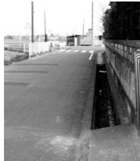
通学路に蓋の無い側溝は危険

問 子どもは国の宝です。通学路の安全安心対策は、学校と地域が一体となり市民の目と手で子どもを守ることに出来るより良い環境作りが必要