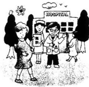
広がる自治体助成

問 妊婦健診の費用は若い世代にとって重い負担です。経済的理由で受診回数を減らしたり、飛び込み出産で、母子ともに亡くなる痛ましい事故が相次いでいます。受診の公費負担拡大を早期に求めます。