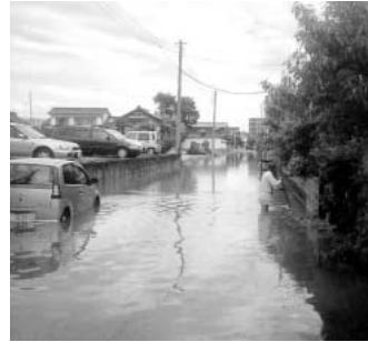
11月に整備されました(整備前)

問 鴻巣市に転居してきた市民から、生活道路の整備が悪いとの内容が新聞に投稿されていました。私も市内を2回程、走って見ています。整備状況は吹上・川里・鴻巣地域の順だと判断しています。