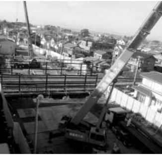
平成21年度完成予定の三谷橋大間線

問 駅東口A 1街区が1年でオープンした。多額の費用が必要で、合併効果であると認識しているが、関連する総事業費の全容は、