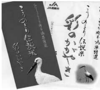
商標登録された「こうのとり伝説米」

問 昨年から生産販売を始めた鴻巣のブランド米「こうのとり伝説米」、の推進は。 答 「こうのとり伝説米」は、減農薬・減化学肥料で特別栽培され、味・つや・香りを追求し、さらに粒の大きさにも