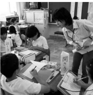
只今 元気に授業中！（屈巢小）

問 法令上、義務化されている小中学校教職員の定期検診実施状況や今後の対応策について伺います。 答 夏季休業中に、視力・聴力・尿・血液などの検査や、胸部と胃部のレントゲン撮影