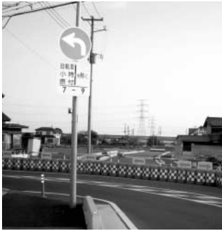
開通が待たれる三谷橋バイパス

問 開通予定はいつですか。 答 20年度内の予定です。 問 市道H 212号線の交差点の形態はどうなるのか。 答 視認性に配慮し、直角に近い接道を検討しています。