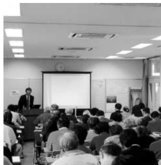
大盛況の立教大学公開講座

問 原油高騰による給食食材への影響と購入の対策は。 答 毎月開催している給食物資選定会議において、安全第一に、味がよくて安価な食材や加工品を選定し購入するとともに、加工品を中心に共同