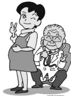
妊婦健診5回まで無料に！