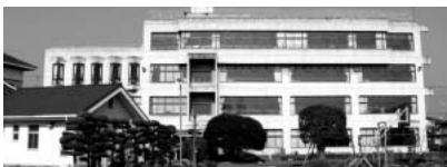
耐震診断を急がれる吹上小高学年普通教室

問 吹上小普通教室棟の改築時期については、大芦小並びに吹上小の高学年普通教室棟の第二次耐震診断調査結果との関連があります。吹上中ブレハブ校舎のリース期間内に完了するためには、吹上小の耐震診断を計画より早める必要があります。教育委員会の見解を伺います。 答 今後は指定管理者モニタリング指針を作成し、指導・監督の適正化を図ってまいります。