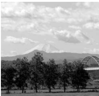
富士の見えるパーク ゴルフ場増設を