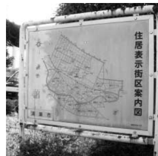
吹上支所前に掲示されている 街区案内図

問 市内の行事の把握はどの課が把握していますか。 答 秘書室広聴広報課が主管となっております。行事情報については「広報かがやき」やホームページで連絡のあった団体などを知らせます。