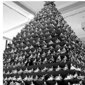
2月には鴻巣市の産業観光とも言えるびっくりひな祭り、フラワーフェスティバルが開催される

問 商業・工業・農業のバランスのとれた発展をどう目指していくか。 答 第5次総合振興計画に基づき、商業では商店街にぎわい促進事業、市営駐車場管理運営事業など9事業を、工業