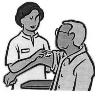
予防接種で肺炎死亡率の抑止を

問 本市の死亡者全体における死因別死者数及び死亡割合は、数値の高い順に、悪性新生物、心疾患、肺炎、脳血管疾患となっています。肺炎については、肺炎球菌ワクチン