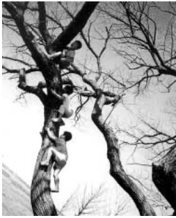
太陽と水と土と友達と共に... どんぐり保育園