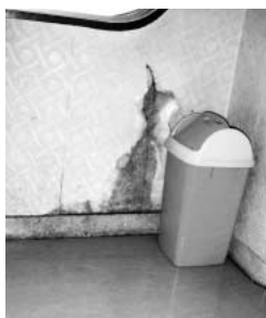
台風9号の豪雨により吹上公民館が雨漏れのために汚れた跡

問 市民生活の毎日は、多くの物やエネルギーを消費する日々の生活から、様々なゴミを出しています。大量生産、大量消費と消費は美德と云う経済発展の時期がありました。人間の勝手な考えから、地球を汚染した結果、温暖化と言われる気象異変、北極・南