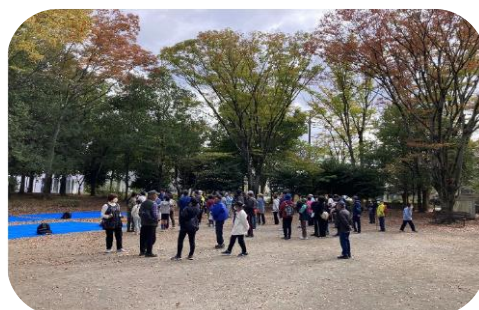
ウォーキング大会

登戸自治会集会所～赤見台近隣公園 赤見台近隣公園で宝探しゲーム、お弁当を食べて帰路に向かいます。