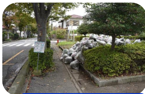
街路樹落ち葉清掃

11月下旬と12月中旬の計2回、自治会にて落ち葉清掃を実施し、住みよい地域づくりに取り組んでいます。