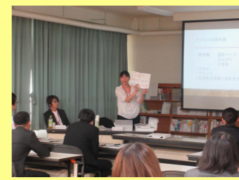
子どもや保護者との関わり方、教材づくりの実際等、今後の参考となる豊富な実践を紹介していただきました。