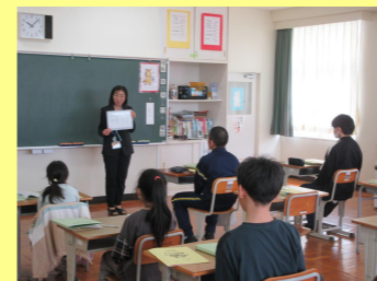
学校の始業式から1週間遅れのスタートです。通級児童生徒と指導員が、お互いに自己紹介しました。