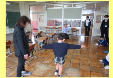
上手にバランスを取ってロープ渡りができました。毎月、年長児が楽しみながら学習や運動に取り組みます。