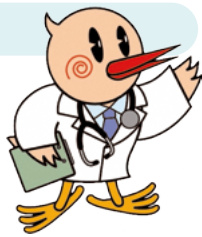
鴻巣市メインキャラクター 「ひなちゃん」