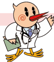
鴻巣市メインキャラクター 「ひなちゃん」