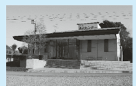
鴻巣典礼センター

こうのす商工葬祭はどなたでもご利用できます 24時間 365日対応 事前相談承ります