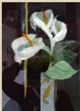
カラー 名古屋 弘子