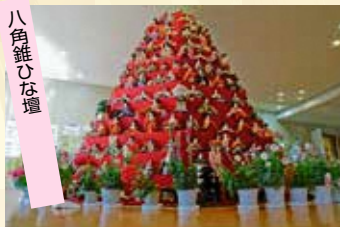
コスモスアリーナふきあげ

サテライト会場・展示会場ともに日時は会場により異なります。詳細は「鴻巣びっくりひな祭り」ホームページをご覧ください。