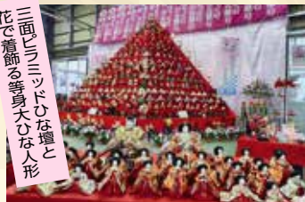
鴻巣農産物直売所「パンジーハウス」