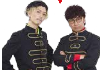
エグスプロージョン