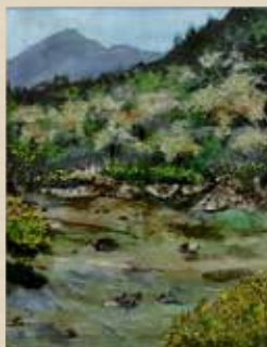
春の清流 杉田 立江