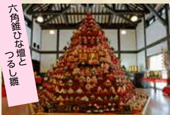
花と音楽の館かわさと「花久の里」