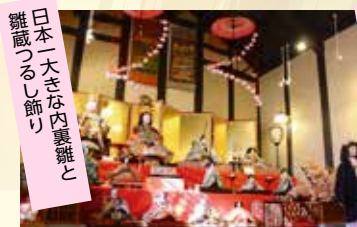
産業観光館「ひなの里」