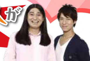
ハイキングウォーキング