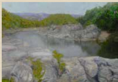
長瀬・五月 唐橋 美保子