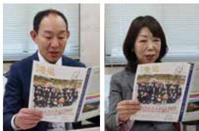
広報1月号「新年のあいさつ」を録音する並木市長(左)と織田市議会議員