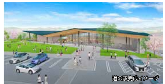
道の駅施設的设计業務を実施