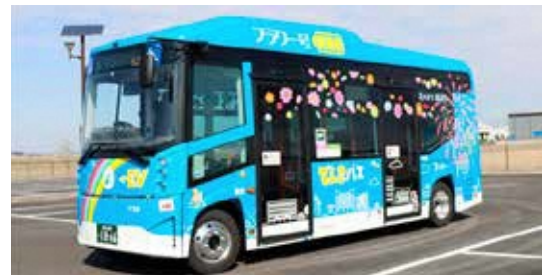
フラワー号に2台目のEVバスを導入