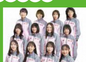
しまむら 女子陸上競技部