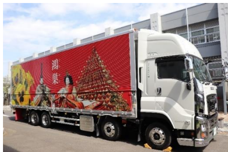
ラッピングトラックによる 鴻巣市のPR (ロードネット株式会社様)