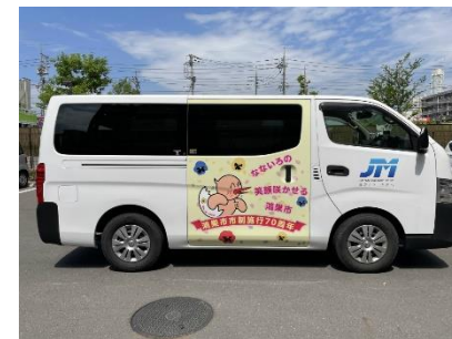
巡回点検車両へのラッピング による鴻巣市のPR (株式会社JM様)