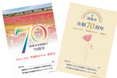
PRポスターの作成・提供 (株式会社アサヒコミュニケーションズ様)