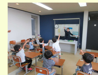
運動に、勉強に、元気いっぱいの子供たちです。次回(第2回)もスタッフが楽しみに待っています。