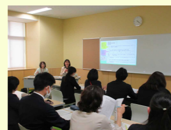
会場いっぱいの受講生は、熱心にメモを取っていました。明日からの実践につながる、具体的な講義内容でした。