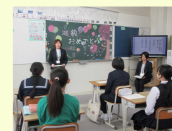
在籍校の校長先生方を来賓としてお迎えしました。少し緊張しましたが、和やかに新年度が始まりました。