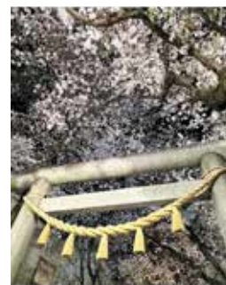
@hanahana0321megu #鴻神社 #夜桜ライトアップ #鳥居の下から