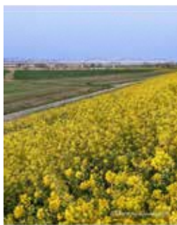
@kounosulife #荒川水管橋 #菜の花 #春の景色