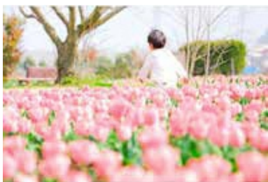
@ai_mitsuda6.2 #ピンク色のじゅうたん #チューリップ #花のオアシスにて