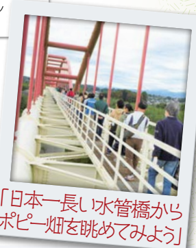
「日本一長い水管橋からポピー畑を眺めてみよう」