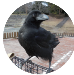
ハシブトガラス 約600g