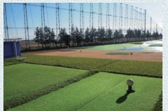
300ヤード・88打席の解放感あふれる練習場 鴻巣ジャンボゴルフセンター