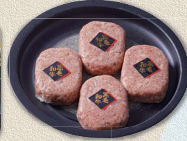
黒毛和牛ハンバーグ 120g×16個セット