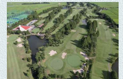
世界の様々な有名コースをアンサンブル 鴻巣カントリークラブ

首都圏からも程近い距離にありながら、緑あふれる鴻巣市では、自然の中で楽しむアクティビティも◎