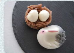
御菓子司もみじやの生菓子/ 幸乃鳥・ゆりかご