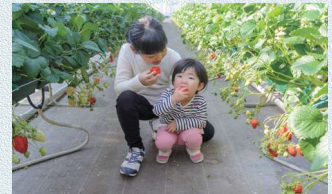
高設栽培・可動式プランターで子供や車いすの方も◎ 観光福祉農園元気ファームのいちご狩り