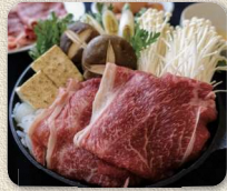
松川牧場のこだわり牛肉 すき焼き肉500g

燗ニイチクでは老舗和牛専門問屋の目利きと秘伝の製法で作られたハンバーグなど、牛肉の旨さを味わえる自慢の逸品が人気です。