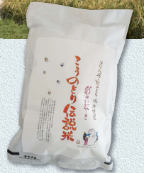
JAさいたま鴻巣営農経済 センター/こうのとりの伝説米