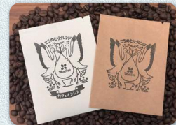
78coffee/こうのとりのブレンド