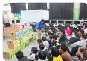
コウノトリ ゲストティーチャー授業