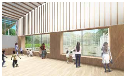
観察スペースイメージ