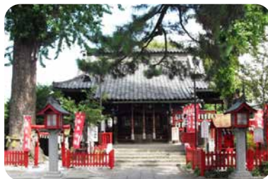
「こうのとりの伝説」が伝わる鴻神社

鴻巣市とコウノトリは古くから縁があります。本宮町にある鴻神社には、「こうのとりの伝説」が伝わり、一説では市名の由来ともいわれています。市では、そのコウノトリをシンボルとして、環境にやさしく、にぎわいあふれる持続可能なまちづくりを、様々な方からの支援を受けながら推進しています。