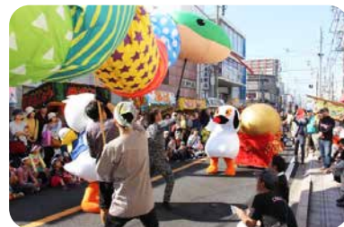
「おとりのまつり」のこうのとりの伝説パレード