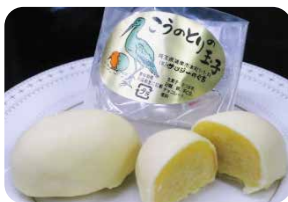
こうのとりの玉子

コウノトリをシンボルとしたまちづくりを通じて、鴻巣市の産業や、地域のつながりを元気にしていきます。コウノトリや鴻巣市を冠したブランド商品の開発や、鴻巣産の農産品の使用を推進していきます。