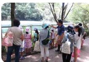
コウノトリ親子見学会

コウノトリの里づくりには、多くの担い手が必要です。特に、将来の担い手となる子どもたちを対象にした取組を展開しています。「環境にやさしいふるさと鴻巣」を、未来に、子どもたちに残していきましょう。