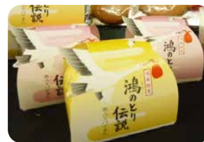
鴻のとりの伝説 (木村屋製菓舗提供)