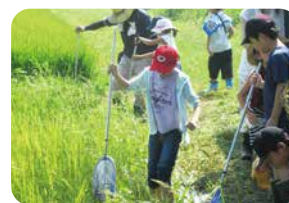
たんぼの生きもの観察会