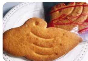
こうのとりのサブレ