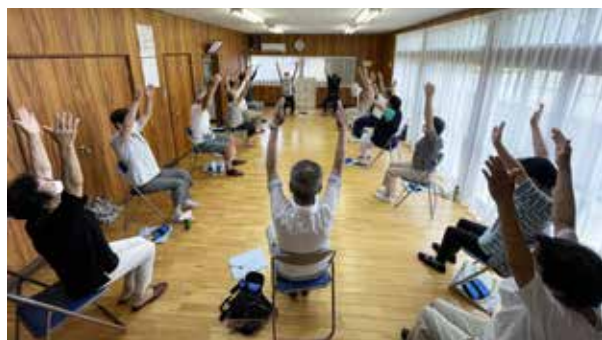
緑町ながいき体操クラブの活動風景▶