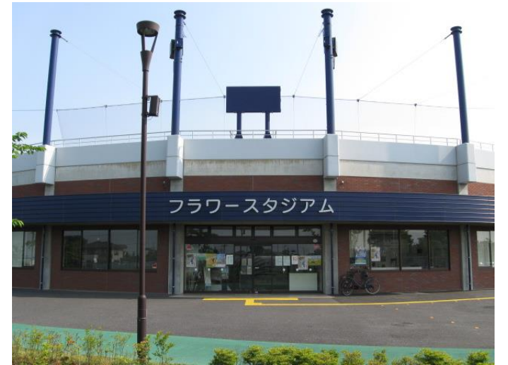
フラワースタジアム