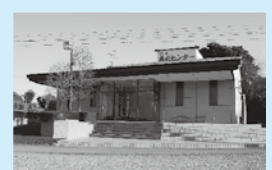
鴻巣典礼センター

このす商工葬祭はどなたでもご利用できます 24時間 365日対応 事前相談承ります