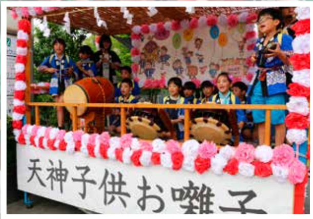
子どもたちの元気な声が響きます