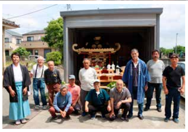
修繕したみこしを披露しました