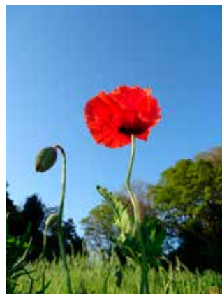
@samapapa_san #シャーレーポピー #このす花まつり #青空とポピー