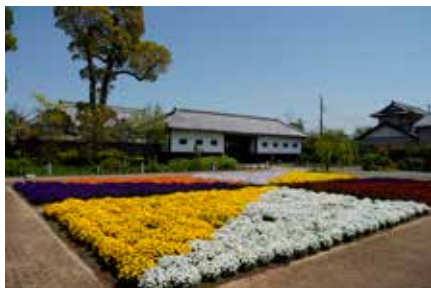
@mswjunko #花久の里 #色とりどりのピオラ #大地の彩り