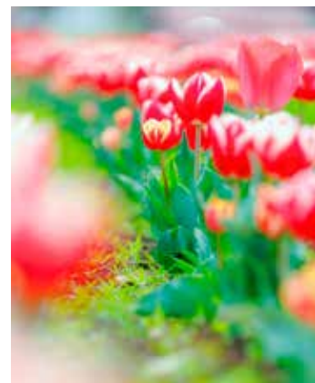
@aira_photos #花のオアシス #満開のチューリップ #春の訪れ